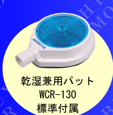
乾湿兼用パット WCR-130 標準付属

スピンドル先端にエアロードを設ける ことで、小口径穿孔中にコアが折れて 吸気口を塞いでもエアロードにより吸 気口を確保し、集塵能力低下を防ぎます。